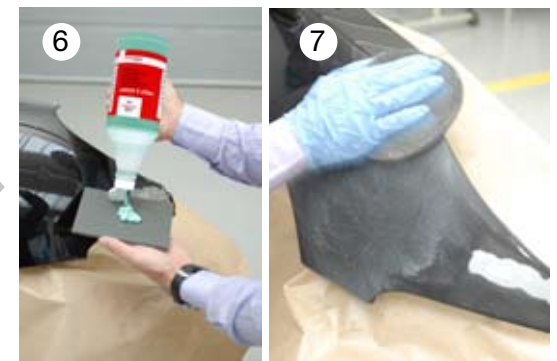
→ Mattieren der Randzone mit Prep & Scuff und Mattflex Grau oder Gold ( Achtung , Schutzhandschuhe tragen)